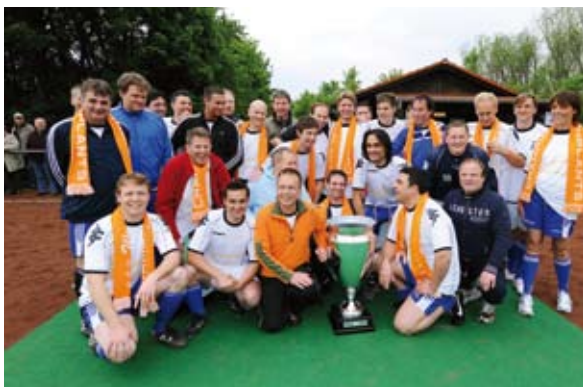
Die Champions Elf, Sieger der Herzen

Ab ca. 14.00 Uhr waren dann alle im Fußballfieber. Zum einen fand gegen 17.00 Uhr das Champions Spiel der Uwe Seeler Traditionself gegen die Champions Anwender statt und anschließend wurde gemeinsam