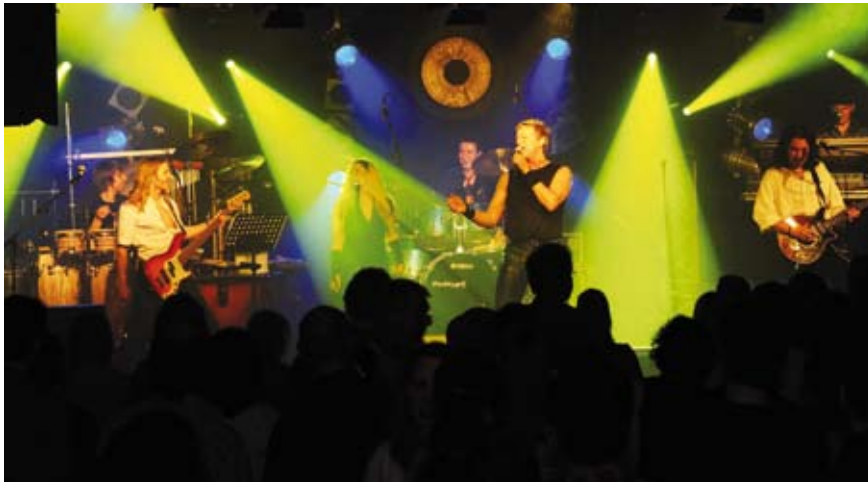
The Queen Kings, Europas beste Queen Tribute Band

sen, voller Begeisterung beteiligten. Beide werden in wenigen Wochen ihren definitiven Zahnersatz eingegliedert bekommen. Den Abschluss des Tages krönte dann noch das Konzert der "Queen Kings" in Flonheim. In einer Vereinshalle in Flonheim sahen über 300 begeisterte Kongressteilnehmer und Gäste aus der Umgebung ein musikalisches Feuerwerk. Die Band begeisterte die Massen vom ersten Titel an und riss ausnahmslos alle in dem ca. 2,5 Stunden dauernden Konzert mit.