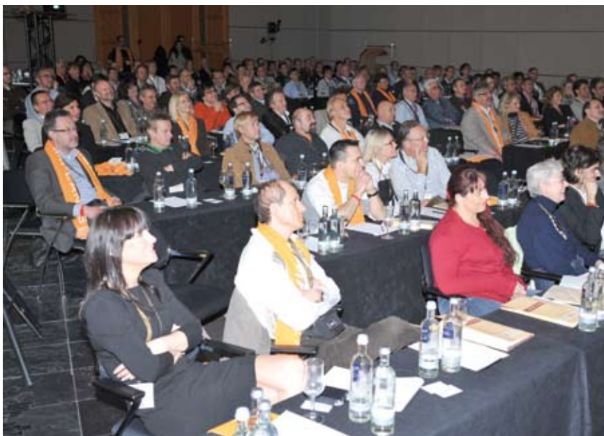
Der erste Kongresstag stand ganz im Zeichen der Fortbildung und der Fachgespräche unter den Kollegen.

Am Donnerstag den 13.05.2010, an dem zahlreiche Kongressteilnehmer zu verschiedenen Themen referierten, war bereits abzusehen und von vielen Teilnehmern zu erfahren, dass hier ein Kongress, „der etwas anderen Art“ stattfindet. Praxisnähe und Kollegialität, abgerundet mit einem Unterhaltungsprogramm, was seines gleichen sucht, machten diese vier Tage für alle zu etwas unvergesslich Schönerem. Der erste Tag endete dann bei einem perfekt organisierten Dinner, vielen Gesprächen unter den Teilnehmern und sehr unterhaltsamer Musik von den Waschbrett Wuzzys.